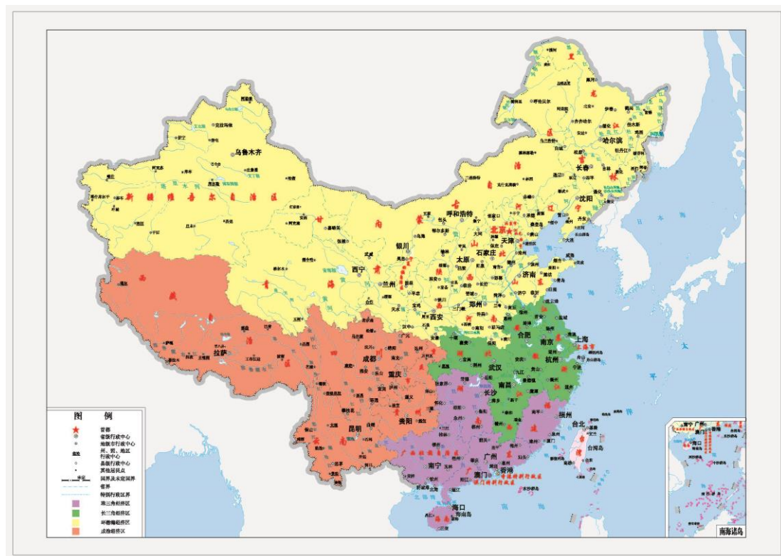
图 2：我国四大经济区及其腹地

地，同时还包括成渝经济区；在脉络上与我国确立的广州、上海、北京、天津、重庆五大中心城市相吻合。其中以广州市为中心城市的珠三角经济区，作为我国改革开放的先行区域，自改革开放以来，驱动了我国 20 年的经济发展，初步解决了我国的温饱问题。以上海市为中心的长三角经济区则以浦东新区的建立为契机，将引领我国从 2000 年至 2020 年的经济体制改革，率领全国经济达到全面小康水平。而以京津为中心的环渤海地区则将完成我国经济实现小康以后，走向现代化的改革之路，同时还承担着振兴东北老工业基地的重任。最后，以重庆为中心的成渝地区，将支撑我国后工业化经济的腾飞，并驱动整个西南地区经济的发展，最终实现全国范围内的共同富裕。以上四个地区的国家级发展战略，为我国的宏观经济规划了一条长达百年的发展之路，同时在地理上将各省连接成一个统一的整体，有着清晰的发展轴线。